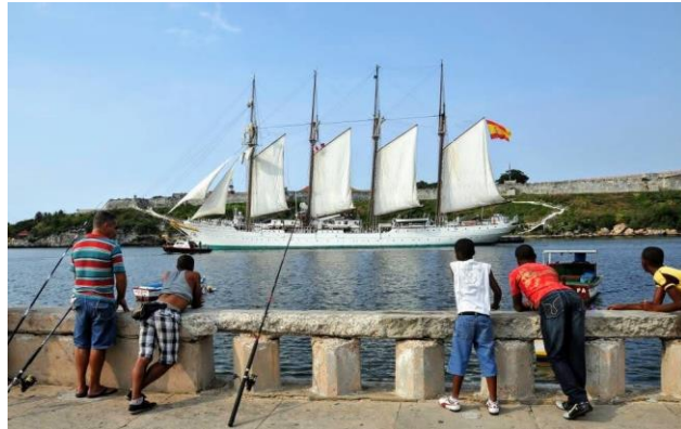
La Habana, puerto

Tu velero del perfil navega sin final sueños de cielo se van mástiles en el mar, los niños mirando están lloran esperando allá solo gaviotas acompañan del cielo en silencio van es el final.