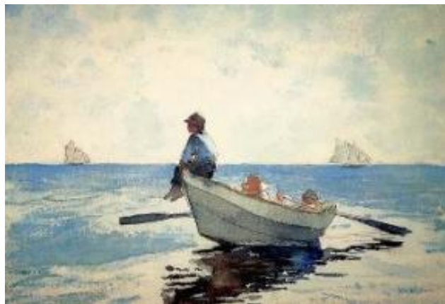
Niños pescadores, Winslow Homer