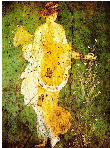
Primavera, fresco Pompeya

En las entrañas nace si abres los ojos al mundo libre los sentidos al viento inquietud de un momento. De muy adentro viene para recrear el punto donde todo era bueno donde todo es en origen.